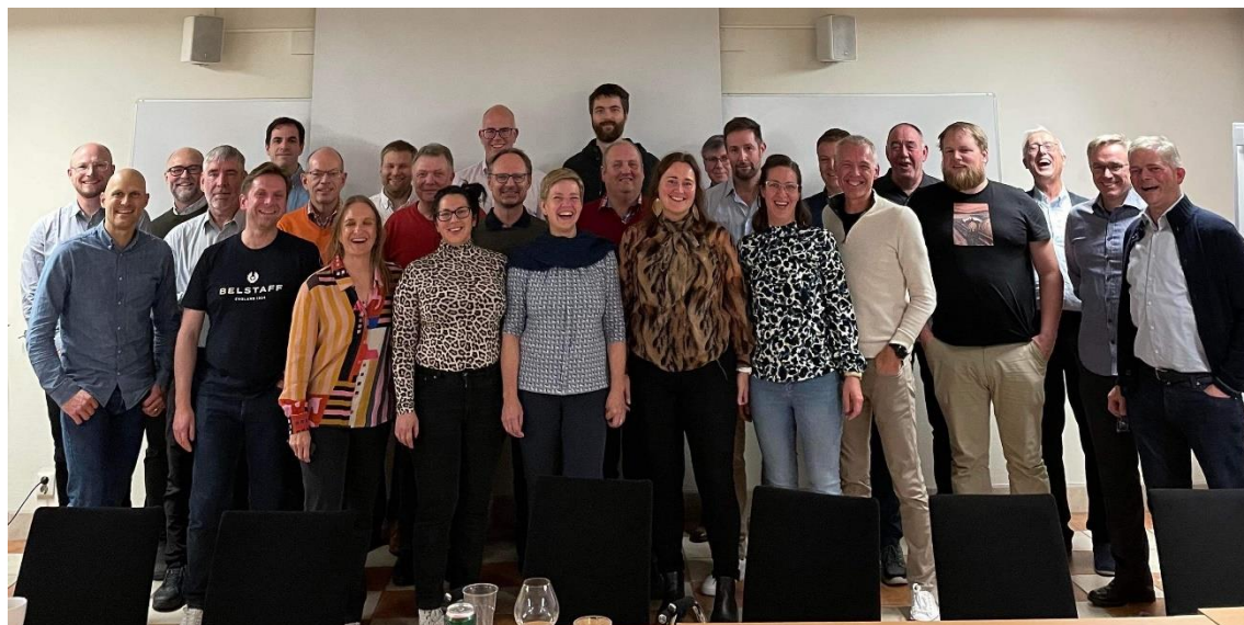
Deltagarna på nordiska domarseminariet i Göteborg

Vi är nu laddade för att ta oss an säsongen 2023 och hoppas på många härliga regattor.