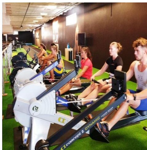
Träning hos Concept Träningsredskap